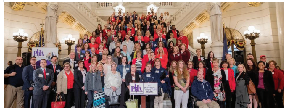
Los defensores del cuidado en el hogar se reúnen en los escalones del Capitolio en Harrisburg durante el Día del cabildeo de 2017, patrocinado por la Asociación de Cuidado en el Hogar de PA.